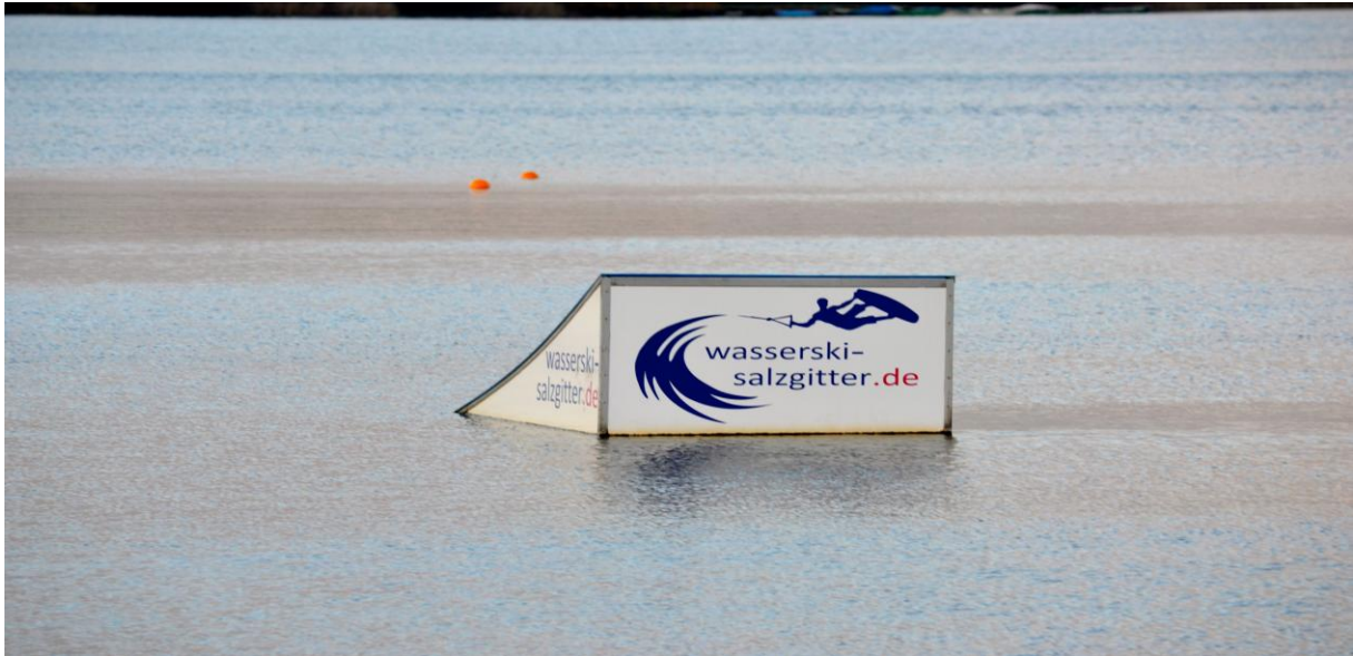
Kicker: Position rechts