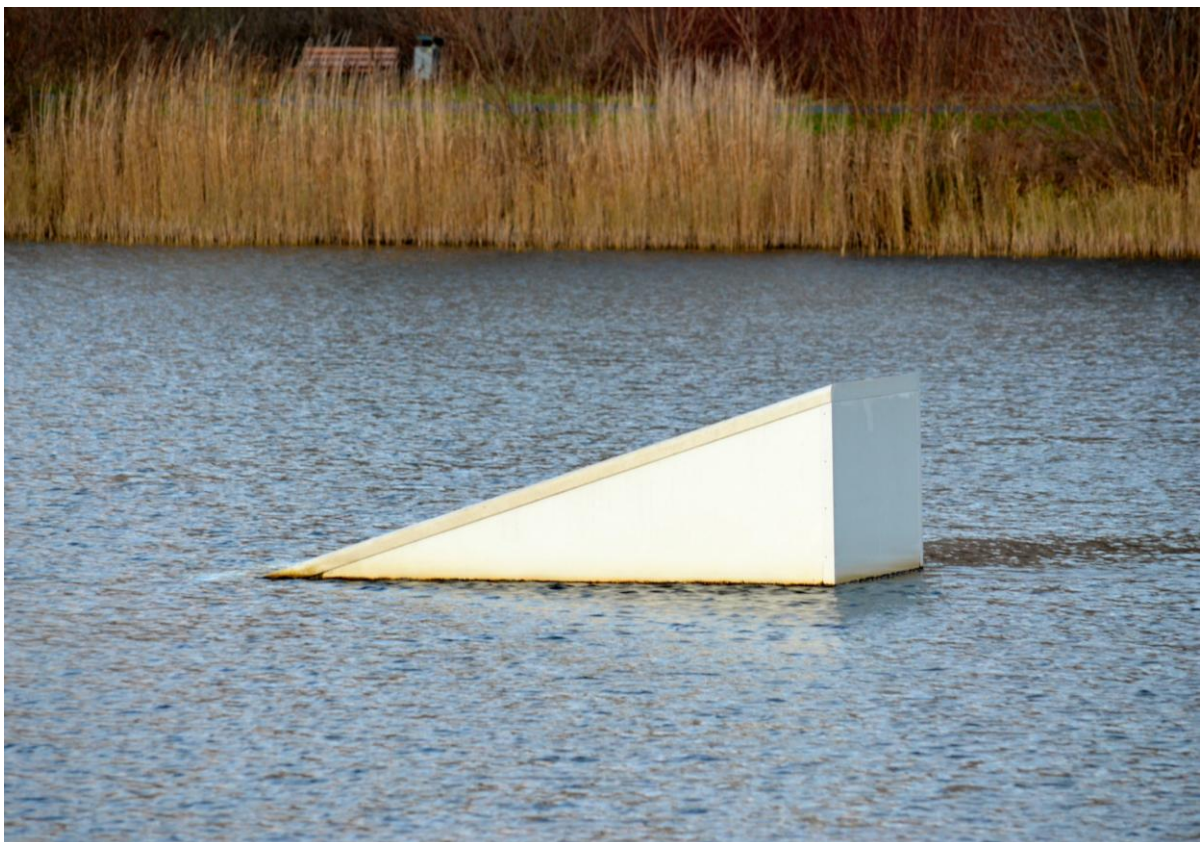
Straightkicker: Position links