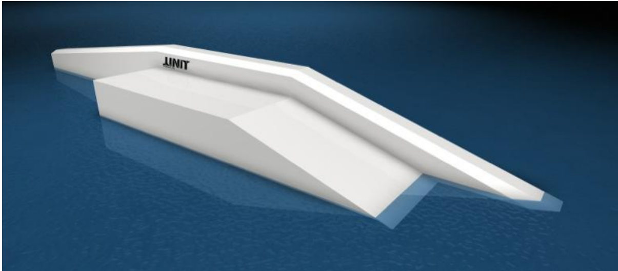
Doublebase Funbox: Position rechts