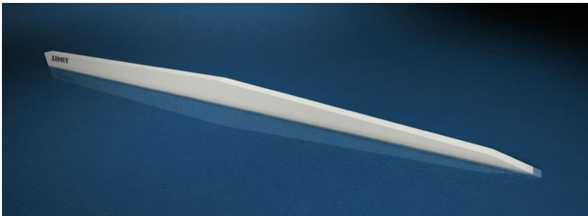
Rooftop: Position links