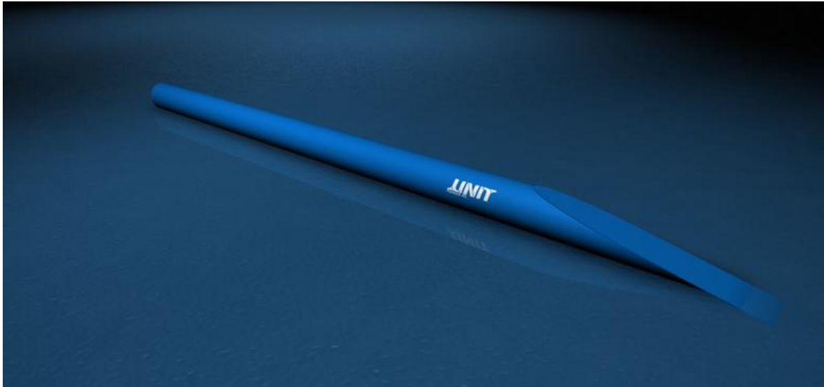
Pipe: Position rechts

In ihrer voraussichtlichen Reihenfolge auf der Wettkampfstrecke: