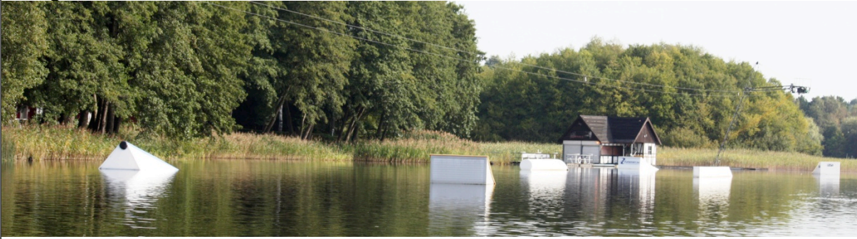
1. L Kicker (Unit), rechts