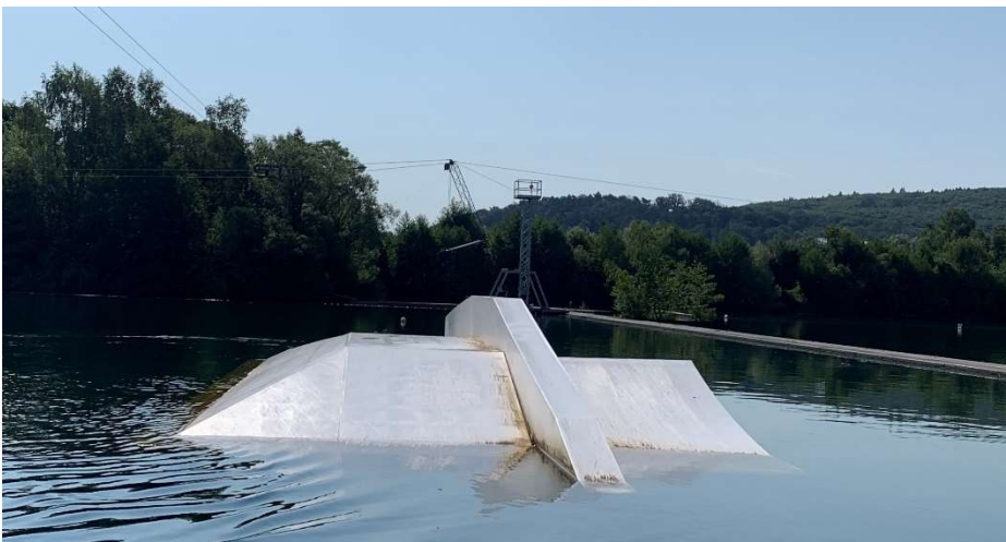
Right side: Rixen Vanni Funbox