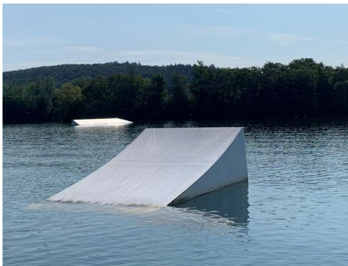
Left side: Unit L Kicker