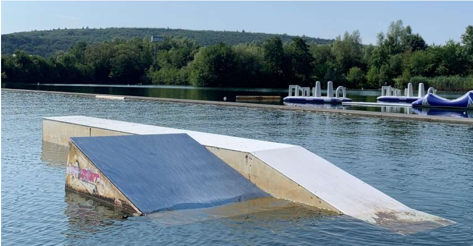
Right side: Kicker + Table Hack