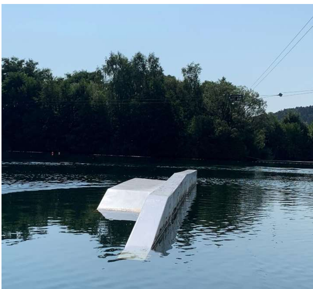
Left side: Shape Rooftop box