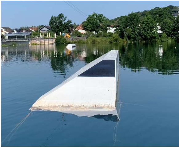
Right side: Unit Bank Ledge