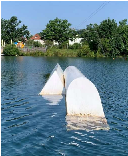
Left side: Unit Pipe + Unit Triangle Hack