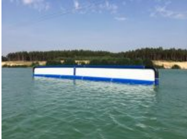
(8) CARLSBERG RAINBOW