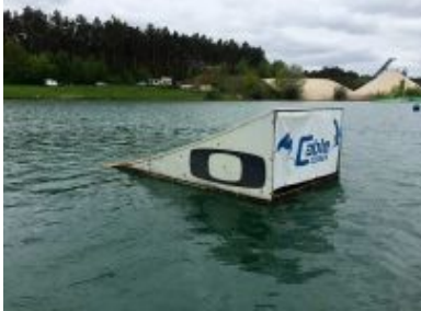
(1) OAKLEY KICKER RECHTS