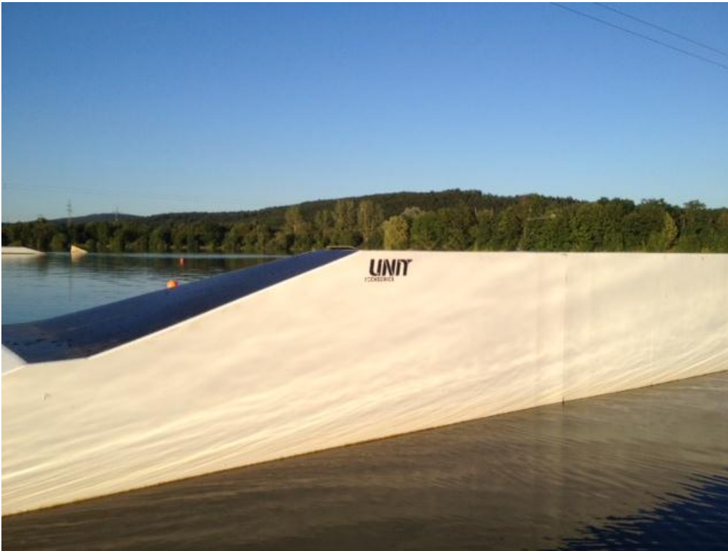
Bank Ledge (rechts)