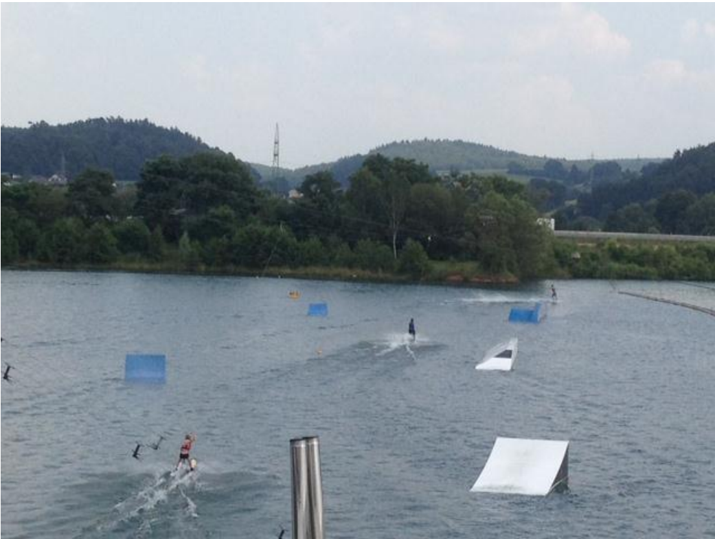
Setup erste Gerade