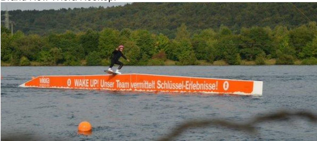
Brand New Wiora Rooftop: