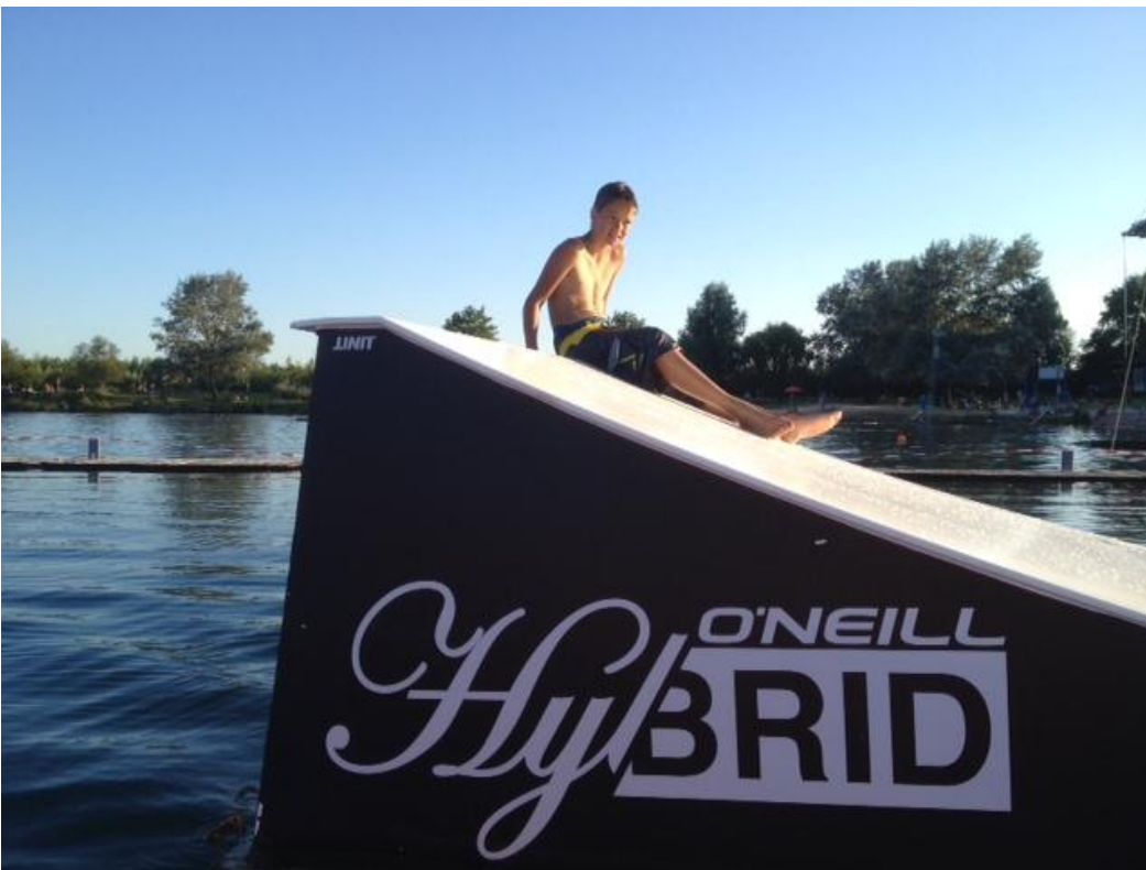
Kicker L (rechts)