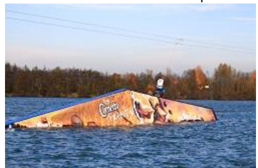
Cornetto Rooftop rechts