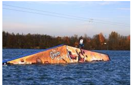
Cornetto Rooftop rechts